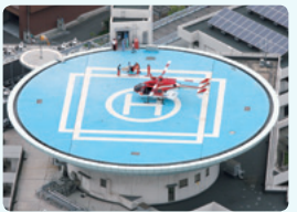
兵庫県災害医療センター