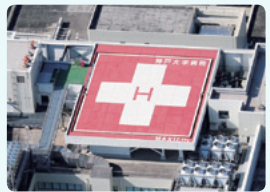
神戸大学医学部附属病院