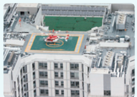
神戸中央市民病院