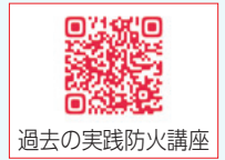
過去の実践防火講座

また、現場に出動する消防隊には、安全に活動するために、過去の火災事例を研究し、消防用設備等を有効に活用するための知識が必要と考えます。今までの防火講座を参考にして、家庭や事業所の安全について今一度見直すきっかけとなれば幸いです。