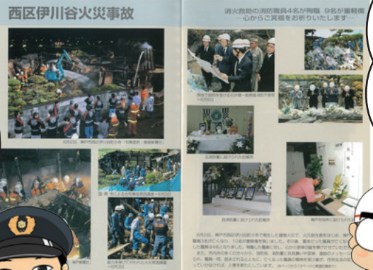
当時の「雪」の巻頭記事 (平成15年7月号No.625)

平成15年6月に神戸市西区で発生した住宅火災です。この火災は、建物の住人の方が火災で亡くならただけでなく、消防職員4名殉職、9名負傷という甚大な被害が発生しました。この現場を経験して、建物関係者はもちろん、消防隊員も含めて、火災による死傷者を根絶したいという強い気持ちが強くなりました。