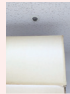
ヘッドの近くまで 物を積み上げないで