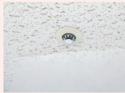
ビニールカーテンが 障害になることも