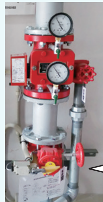
制御弁 (スプリンクラー用)