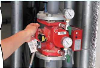
制御弁 (共同住宅用 スプリンクラー用)

スプリンクラー設備でもうひとつ注意しなければならぬこととして、自動で火災を消火してくれるが、消火が終っても 自動で放水が止まらない ということだ。