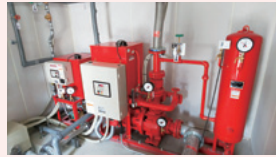
スプリンクラーポンプ