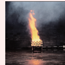
スプリンクラーによる消火例