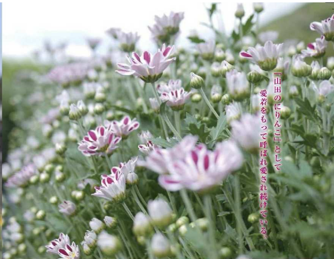
「山田のにりんこ」として 愛着をもって呼ばれ愛され続けている。