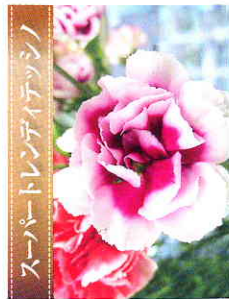
スーパーブレンディテッシノ