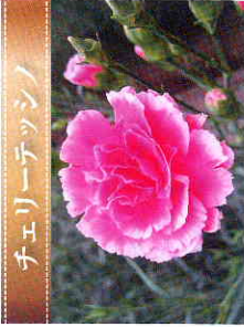
チェリーテッシノ