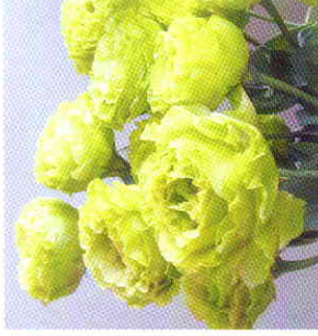
アンバー ダブルミント