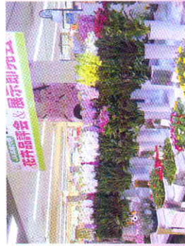
生産者の技術を競い合う品評会

また、従来からあるセンニチコウや、トルコギキョウの一部で生産者育成によるオリジナル品種による生産も行われています。