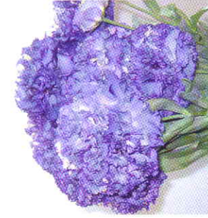
ポヤージュ ブルー