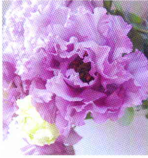
エグゼラペンダー

ギリシャ時代にはすでに薬草として用いられていた、歴史のある花です。その昔、ある国の姫が敵国の王子との逢瀬のために城を抜け出そうとしたところ、ロープが切れて亡くなったため、哀れんだ神様が姫をこの花に変えたというお話があり、「愛の絆」という花言葉もそこからきているようです。