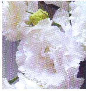
ポヤージュ ホワイト

近年、全国的に高い人気があり、花束やアレンジメント用として、人気が出ているお花です!!