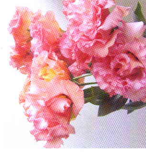
ポヤージュ アプリコット