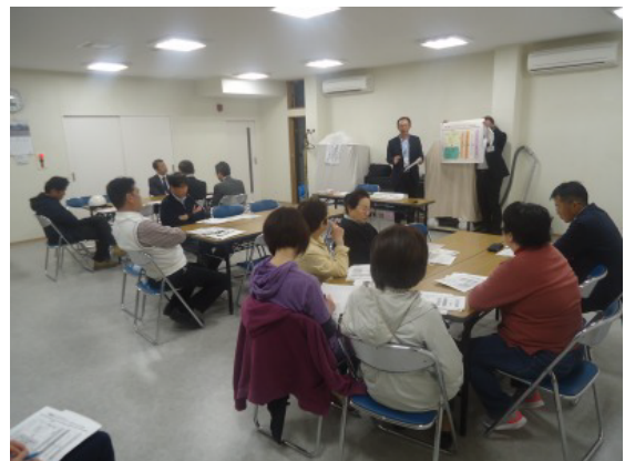
【第4回準備会の様子】→

第4回準備会の1つめのテーマとして、まちづくり協議会の規約の核となる“まちづくり協議会の目的”について前回の意見を踏まえた案がアドバイザーより示されました。ご参加いただいたみなさんから特に異論は無く、正式にはまちづくり協議会設立時に承認を得るので“仮決め”ではありますが、まちづくりのコンセプトがまとまったといえます。まちづくり協議会の目的は、以下の通りです。