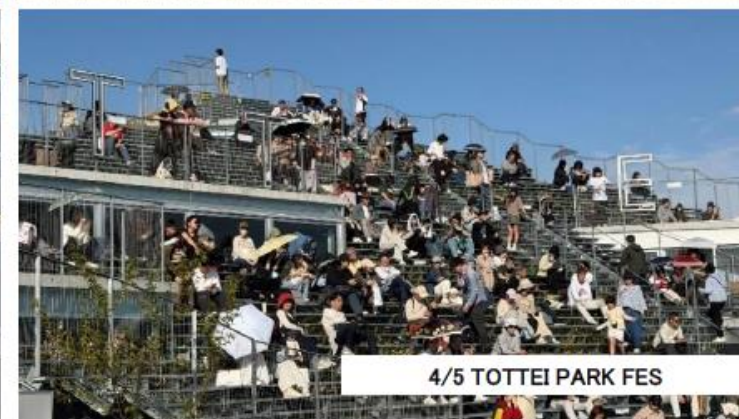
4/5 TOTTEI PARK FES