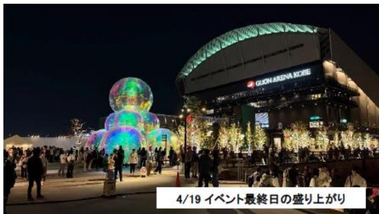
4/19 イベント最終日の盛り上がり