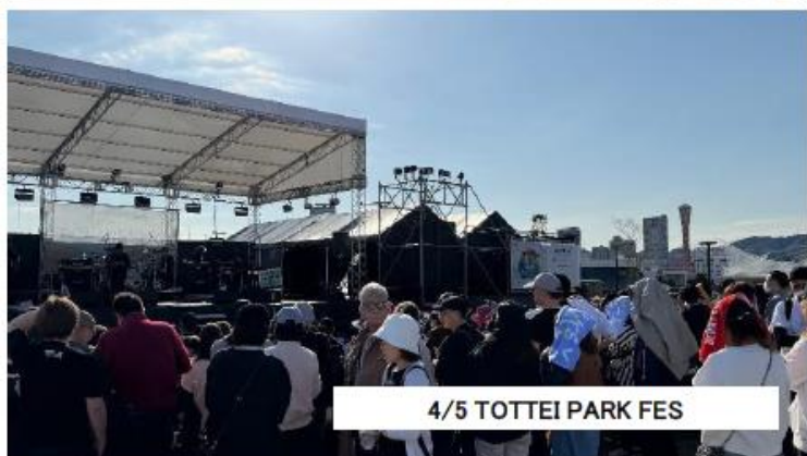
4/5 TOTTEI PARK FES