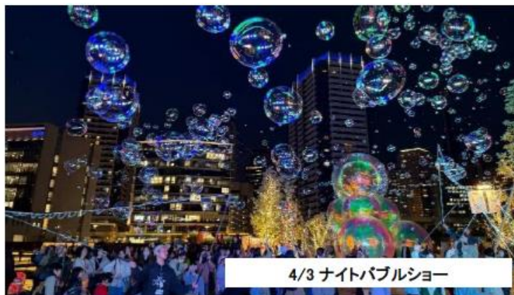
4/3 ナイトバブルショー