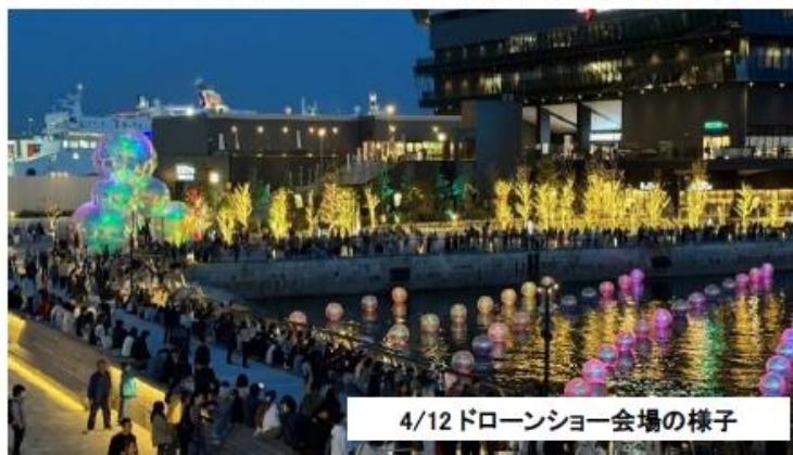
4/12 ドローンショー会場の様子