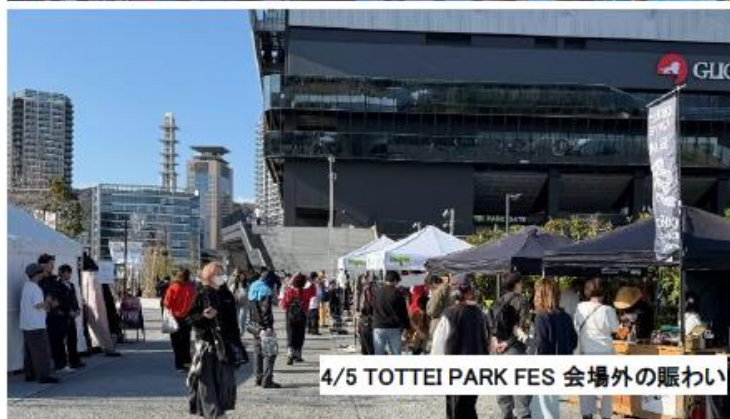
4/5 TOTTEI PARK FES 会場外の賑わい