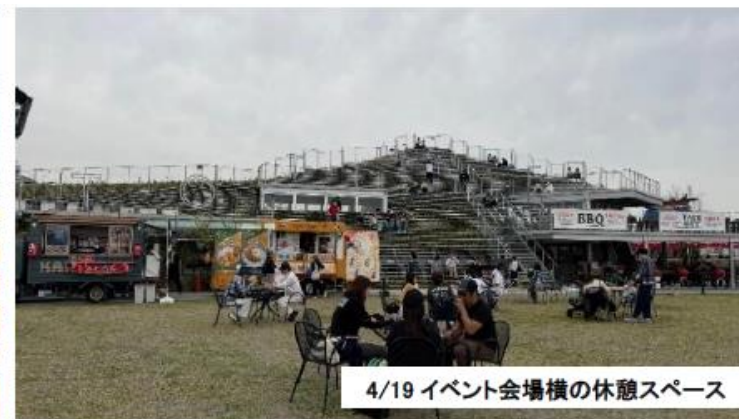
4/19 イベント会場横の休憩スペース