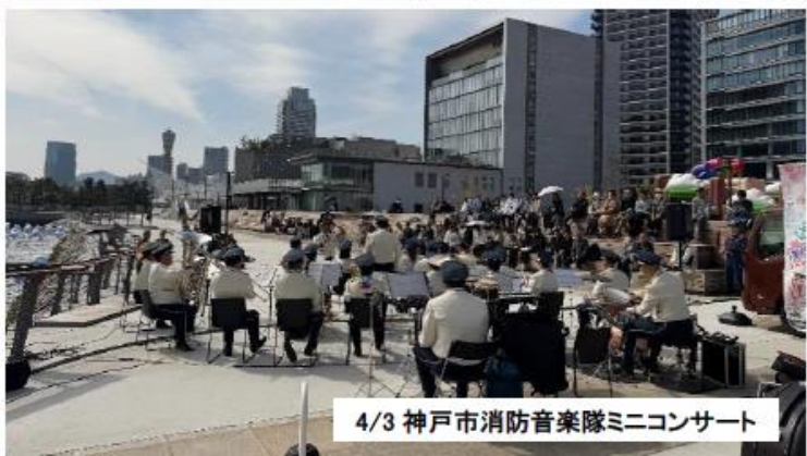
4/3 神戸市消防音楽隊ミニコンサート