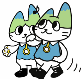
キャラクターを重ねて利用