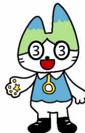
表情など細部の部分的変更