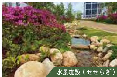
水景施設 (せせらぎ)