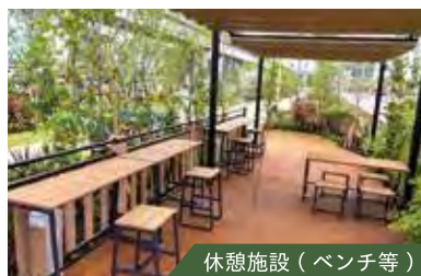
休憩施設 (ベンチ等)