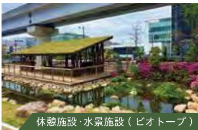
休憩施設・水景施設 (ピオトープ)