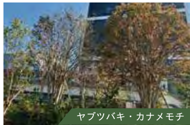
ヤブツバキ・カナメモチ