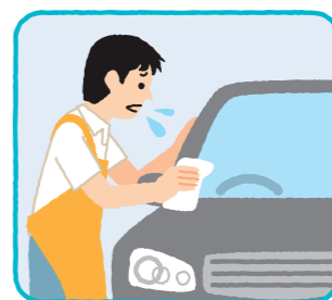
自家用車の洗車・清掃