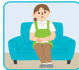
単なる見守り、安否確認、留守番、話し相手

※換気扇や照明器具、エアコン、ベランダ等の掃除も、日常の家事の範囲を超える行為です。