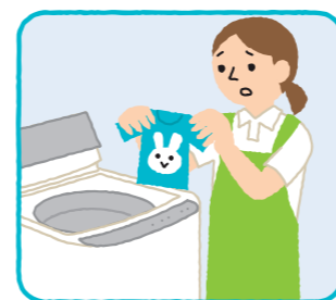
利用者本人以外の者のための洗濯・調理・買い物