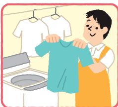
洗濯、衣類の整理・アイロンがけ、簡単な被服の補修

本人が一人暮らしで身体状況などにより自分では家事が困難な場合や、同居する家族等が傷害や疾病等、または同様のやむを得ない事情により、家事が困難な場合に、利用できます。