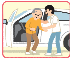
車から乗り降りする介助

訪問介護員自ら運転する車両への乗車前・降車後の屋内外の移動・受診等の手続きを含みます ※病院の待ち時間は含まれません。