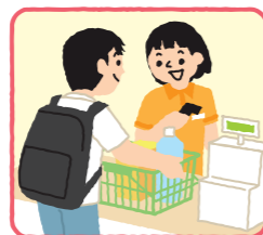
日常生活に必要な買い物