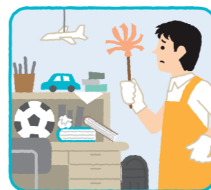
主として利用者本人が使用する居室以外の掃除