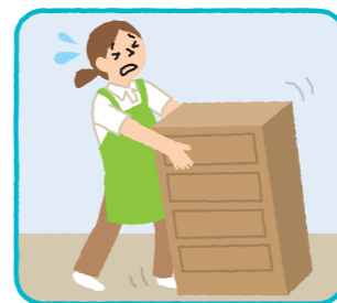
家具・電気製品等の移動、修繕、部屋の模様替え