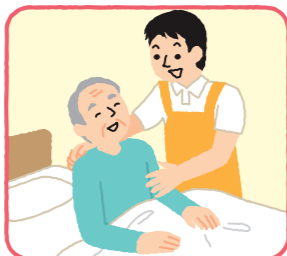
起床・就寝の介助