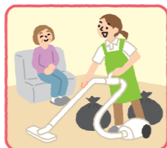
居室の掃除、ごみ出し