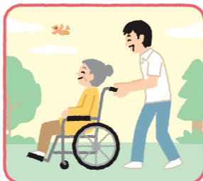
通院・外出の介助