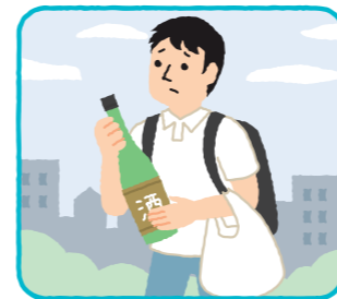
日常生活に必要な物以外(酒類等)の買い物