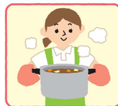
一般的な食事の準備、調理・後片づけ