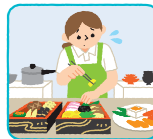
特別な手間をかけて行う料理(おせち料理など)