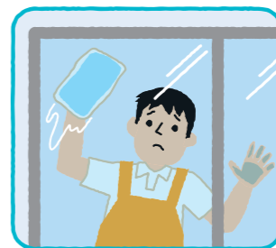
大掃除、窓のガラス拭き、床磨き