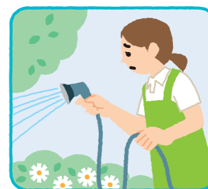
草むしり、花木の水やり