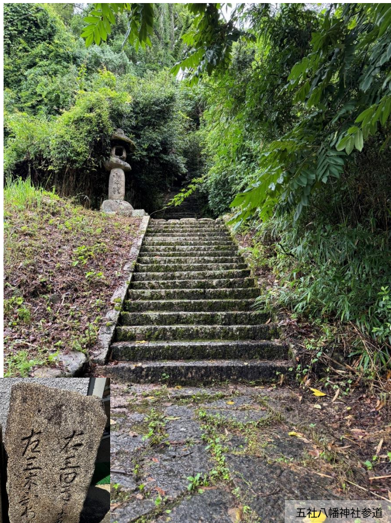
五社八幡神社参道

神戸を代表する六甲山系と、帝釈丹生山系とを隔てる有野川沿いの谷間に位置し、周辺には、五社の名前の由来となった八幡神社や、旧有馬街道など、由緒ある歴史遺産が存在する。