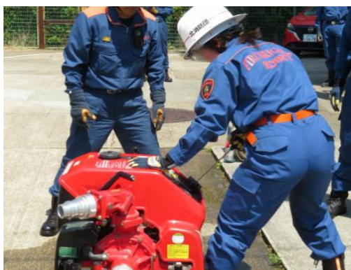
小型動力ポンプ訓練

地域の防災拠点としての機能強化を図るため、老朽化した消防団施設の現状を調査し計画的な整備を進める。また、消防団員の入団促進に取り組むとともに、小型動力ポンプ積載車及び小型動力ポンプを更新する。