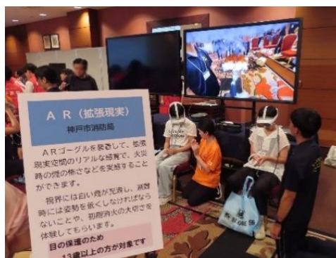
ARを活用した災害疑似体験

市民の防災意識の向上を図るため、火災・土砂災害VR、消火訓練AR及びVR起震車を活用した防災教育を実施する。また、若い世代を対象とした市民救命士講習を推進し、応急手当の普及を図る。