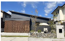
エイジングハウス