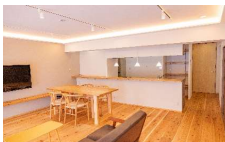
高性能住宅コンソーシアム