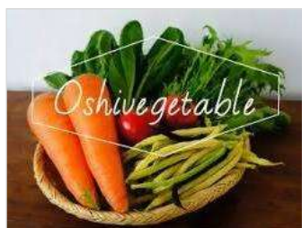
押部谷地域の農家グループ