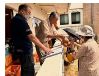
購入者への受渡し