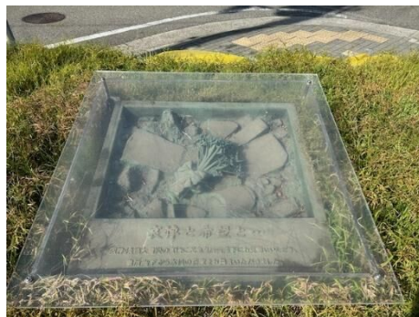
▲上皇后陛下が手向けられたスイセンの花束（左写真）とレリーフ（右写真）