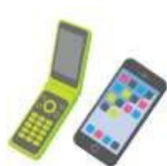
携帯電話・ スマートフォン