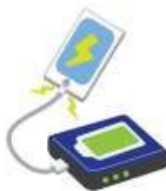
モバイル バッテリー