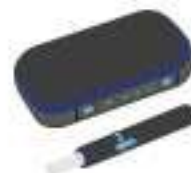
加熱式たばこ・ 電子たばこ