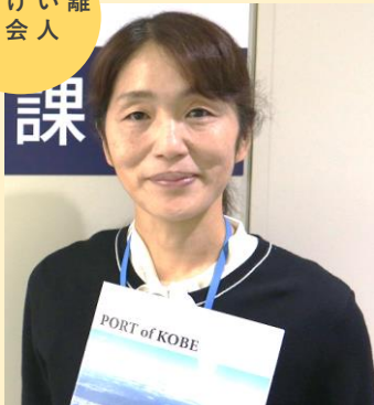
海務課係長 平成10年入庁