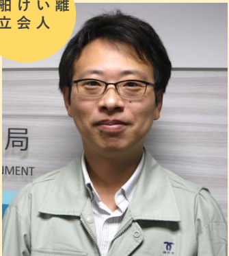
物流戦略課係長 平成25年入庁