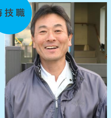
海務課係長 平成4年入庁