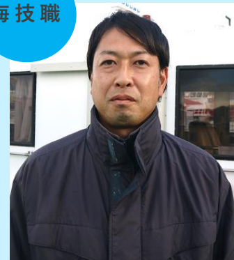
海務課担当(機関) 令和7年入庁