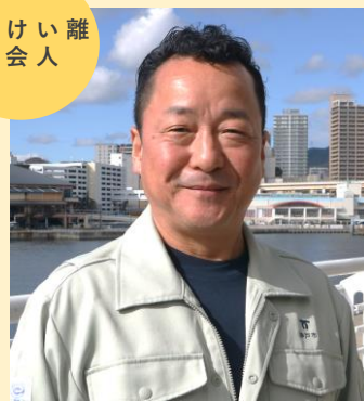
海務課担当 平成8年入庁