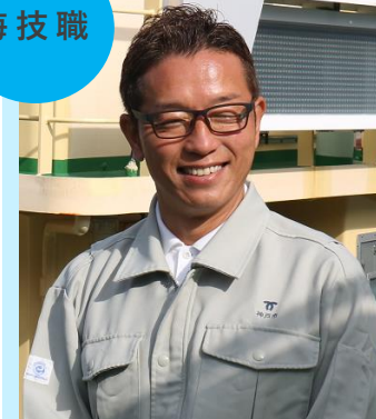
海務課担当(船長) 平成7年入庁