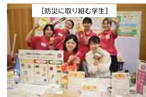
（提供）神戸学院大学 防災女子