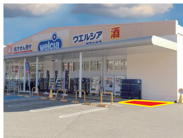
⑩マックスバリュ（ウエルシア西端）