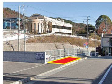
⑨大池駅（北側駐車場前）