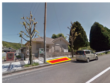
②ひばりが丘集会所