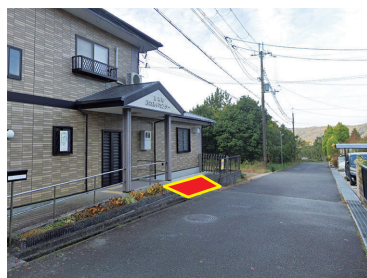
③ふれあいセンター