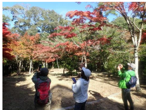
自然観察、仙人谷の紅葉を観察