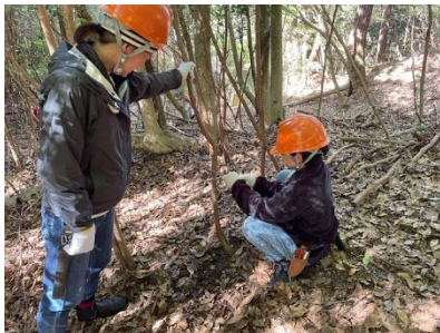
新規参加のお子さん、初めて木を切ります。