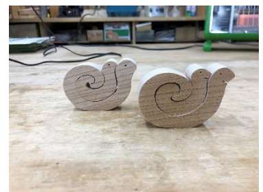
製作した干支の置物