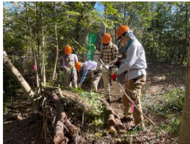
手入が進んで日当たりが良くなりました。