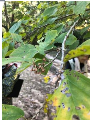
シナマンサクの葉芽と花芽