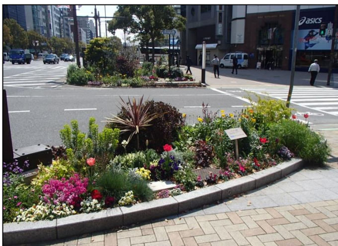
9. ブリッジメンテナンス(株)