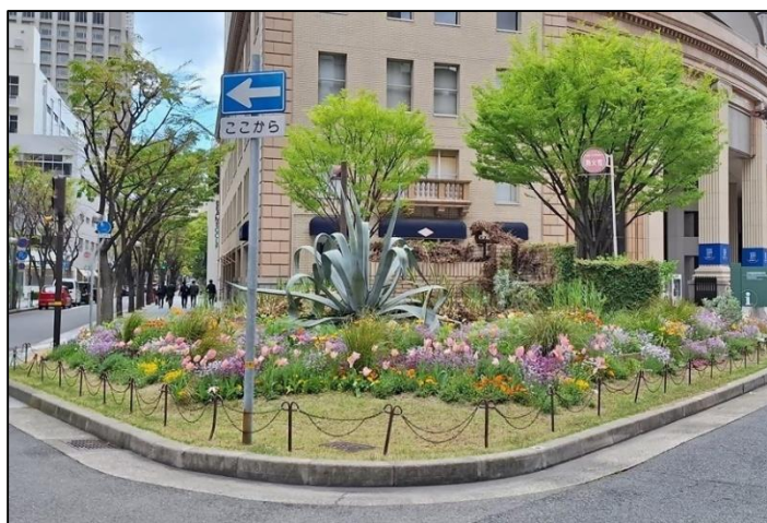
8. 西日本電信電話(株)兵庫支店