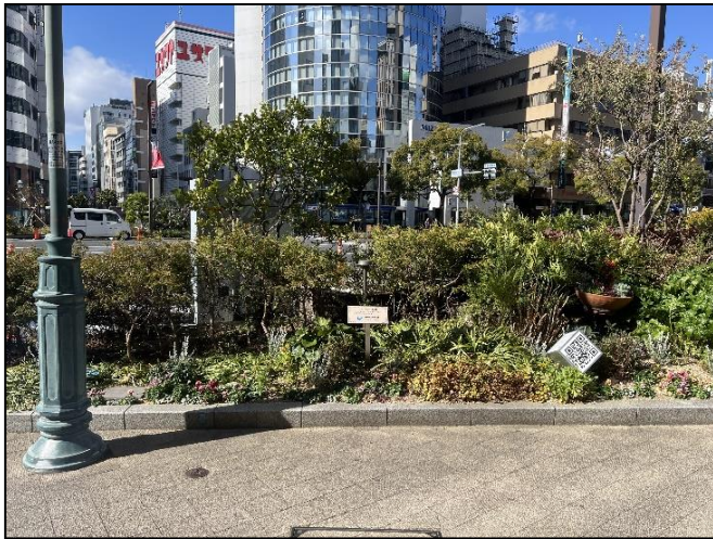
19. プライムプラネットエナジー&ソリューションズ(株)