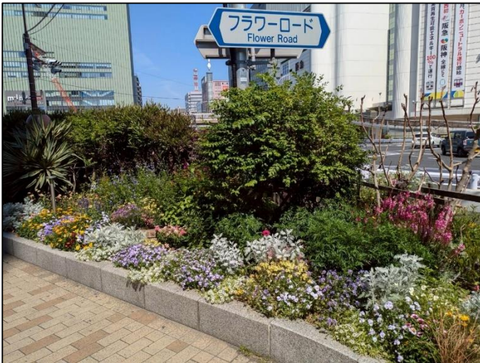
5. (株)グランビスタ ホテル＆リゾート