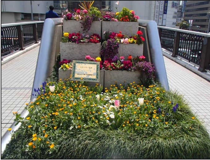
1. 一般社団法人神戸市造園協力会