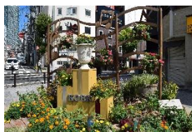
Floral Installation花壇のイメージ写真

※現在、神戸市では「自然の景」の創出による新たな緑と花のブランディングの取り組み