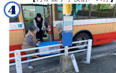
4 地域福祉センター近くのバス停で 住民(ボランティア)が受け取り