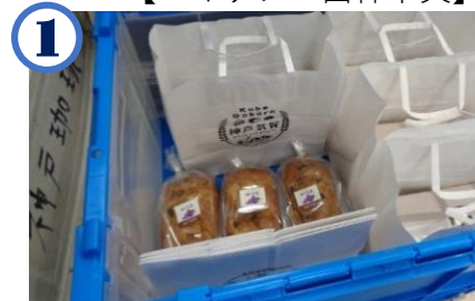
1 予約のあった商品を 配送ケースに入れる