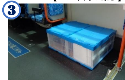
3 路線バスで商品を配送