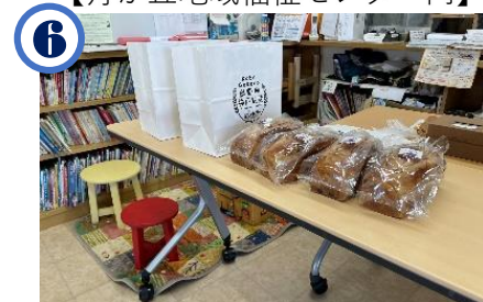
6 予約された方が商品を受け取る