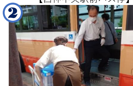
2 店舗からバス停まで運び バスに積み込む