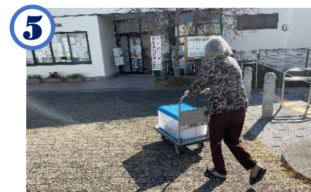
5 バス停から地域福祉センター まで運ぶ