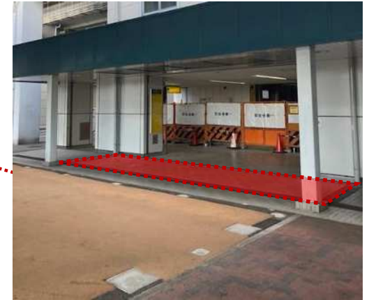
駅舎北出口指定区域