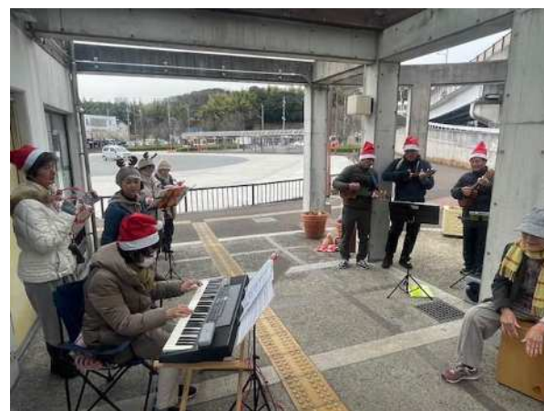
【音楽演奏会の様子】