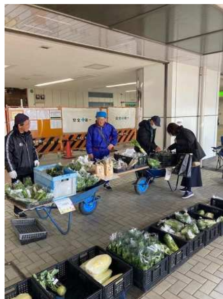
【野菜販売の様子（詰所休憩スペース・駅舎北出口指定区域）】