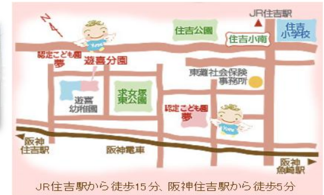
JR住吉駅から徒歩15分、阪神住吉駅から徒歩5分