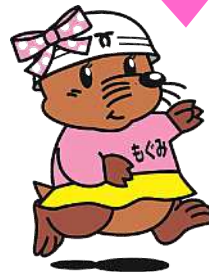
神戸市下水道部 マスコットキャラクター「もくみ」