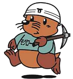
神戸市下水道部 マスコットキャラクター「もぐろ」