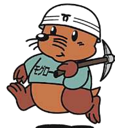
神戸市下水道部 マスコットキャラクター 「モグロー」