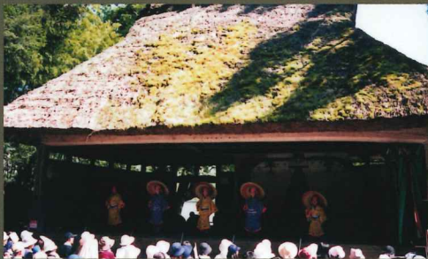
※詳細は決まり次第イベントのWEB サイトにて発信します。

神戸市北区には、いくつもの農村歌舞伎舞台が現在でも残っており、「北区農村歌舞伎上演会」が毎年秋に開催されています。今年は記念すべき第25回目! 色々なプログラムに参加して、みんなで上演会を盛り上げましょう!