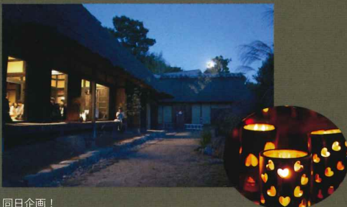
同日企画! 極楽寺付近の竹林で採った竹を使用した竹灯籠を飾ります。

秋の夜長に江戸時代に建てられた茅葺民家でお月見をしませんか。今年も落語をやりませう。今回は米朝一門の桂まん我さんによる落語を一席設けています。一人でも家族でも、友達を誘ってお越しください!