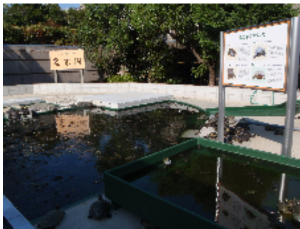
写真 淡水カメ保護研究施設「亀楽園」

アカミミガメの駆除において、その方法を確立し、駆除の効果を検証することに加えて、捕獲したアカミミガメの処分は重要な問題である。駆除後のカメを殺処分することには多くの市民が抵抗感を持っている。亀楽園の目的の一つは、捕獲されたアカミミガメを収容し飼育することで、市民が抵抗なくアカミミガメを駆除できる環境をつくることにある。確かに、駆除したアカミミガメを無制限に収容するわけ