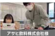
アサヒ飲料株式会社様