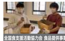
全国食支援活動協力会 食品提供事業