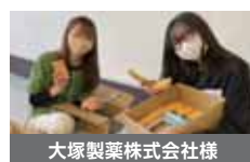
大塚製菓株式会社様