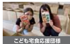
こども宅食応援団様