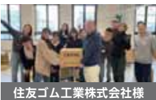
住友ゴム工業株式会社様