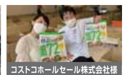
コストコホールセール株式会社様