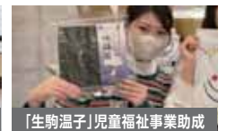
「生駒温子」児童福祉事業助成