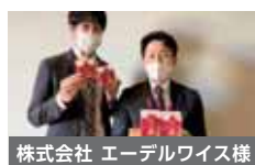
株式会社 エーデルワイス様