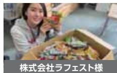
株式会社ラフェスト様