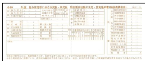
○寄送到您工作单位的文件