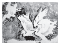
(左から) 安東聖空《月雪花》1980年 / 深山龍洞《清正集》1951年 / 山下摩起《鶯》1961年 いずれも神戸市立博物館蔵

神戸のかな書を代表する安東聖空(生誕130年、没後40年)と深山龍洞(生誕120年)そして画家・山下摩起(没後50年)の作品を紹介します。墨は、紀元前の中国に起源を持ち、日本最古の記述として『日本書紀』に存在が確認されます。三人の作家の個性が展開する豊かな世界、墨がながれ・いろどる形象をお楽しみください。