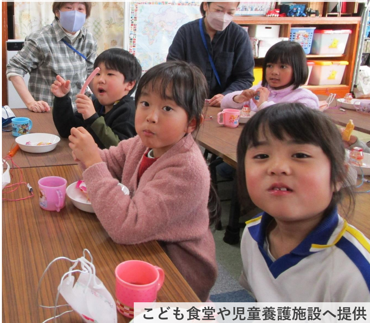
こども食堂や児童養護施設へ提供