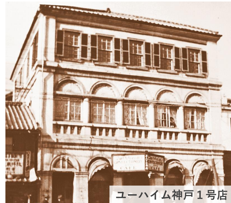
ユーハイム神戸1号店