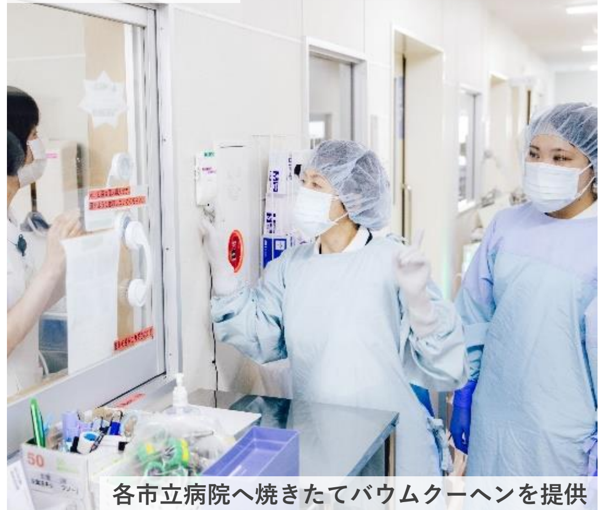
各市立病院へ焼きたてバウムクーヘンを提供