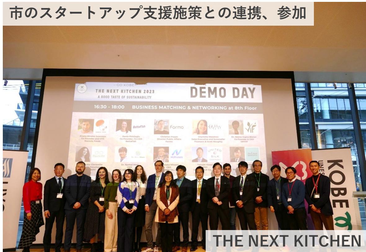
市のスタートアップ支援施策との連携、参加