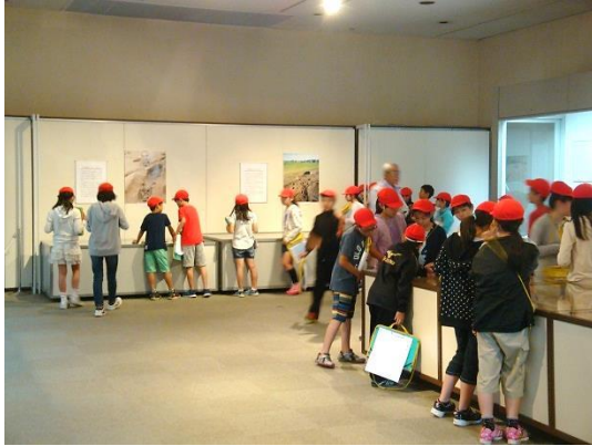
春季企画展 (小学校 6 年生)