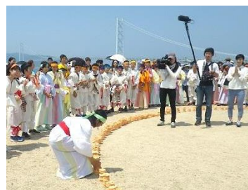
ごしき塚古墳 まつり (NHK 取材)