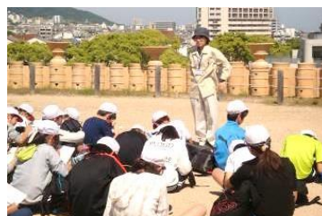
五色塚古墳での 小学生への説明