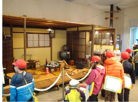
冬季企画展 (小学校 3 年生)