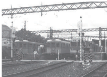
▲ 1987(昭和62)年ごろの有馬口駅

有馬口駅は1928(昭和3)年11月28日に開業しました。現在の1日あたりの乗車人員は約500人。開業当時の駅名は「唐櫃」でしたが、1951(昭和26)年に「有馬温泉口」に改称され、1954(昭和29)年に「有馬口」となりました。