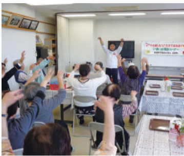
▲ 月に2回茶話会を開催

長尾ふれまちの行事予定は「長尾ふれあいねっと」に掲載していますのでぜひ検索してご覧ください。