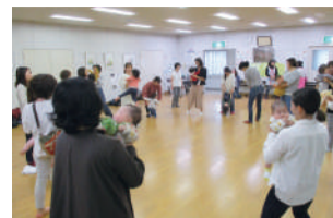
▲ 八多おやこひろば

八多児童館では、児童館から離れた地区(八多町中公民館)で、地域と協働して「八多おやこひろば」を行っています。運営を支援する地域の方は、親子の笑顔が見たいとの思いで受付や託児を行い、参加する親子は楽しい時間を過ごしています。