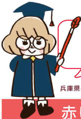
兵庫県共同募金会マスコット あかはねちゃん

『きたくらぶ通信』は... 『北区LOVE』: 北区をもっと好きになる 『北倶楽部』: 北区がより楽しいまち となるための情報紙です。