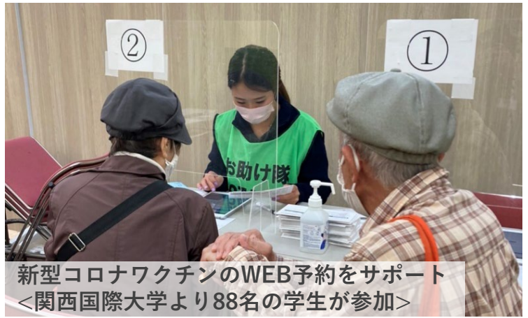
新型コロナワクチンのWEB予約をサポート ＜関西国際大学より88名の学生が参加＞