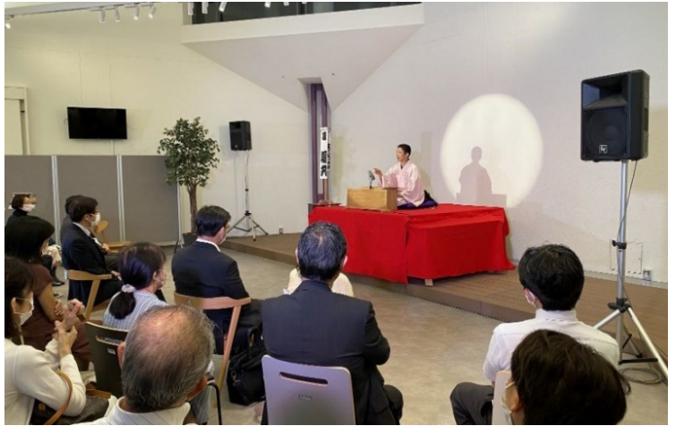
神戸山手キャンパスで伝統芸能に触れる機会として「KUISs神戸山手落語会」を開催 学生有志が中心となり開催、地域住民の方が約90名ご来場