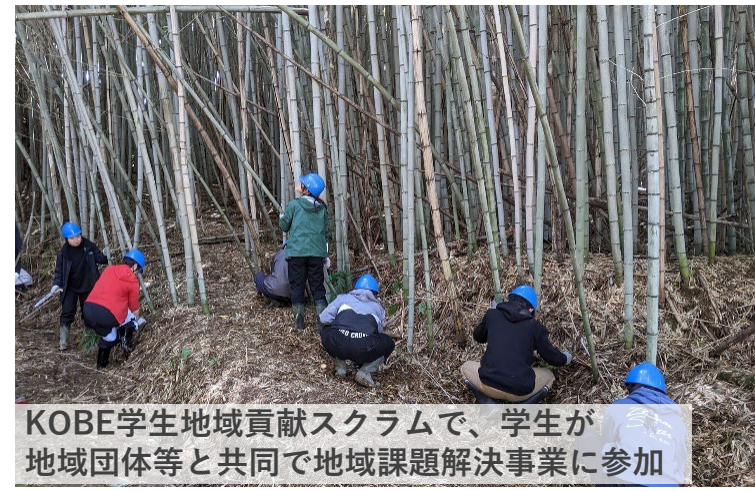
KOBE学生地域貢献スクラムで、学生が 地域団体等と共同で地域課題解決事業に参加