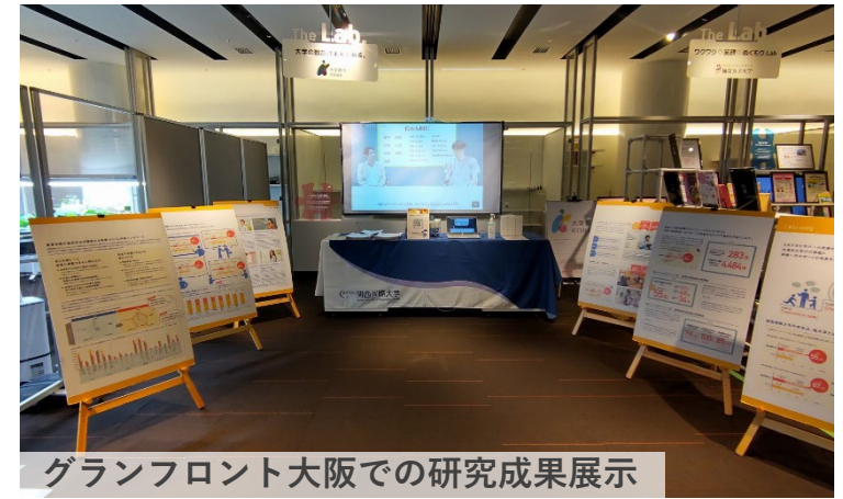
グランフロント大阪での研究成果展示