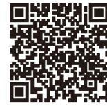
未来の神戸づくりに向けた 大学等応援助成

○神戸市ふるさと納税を活用した未来の神戸づくり に向けた産官学共創の取組みを推進