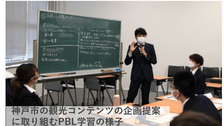
神戸市の観光コンテンツの企画提案 に取り組むPBL学習の様子