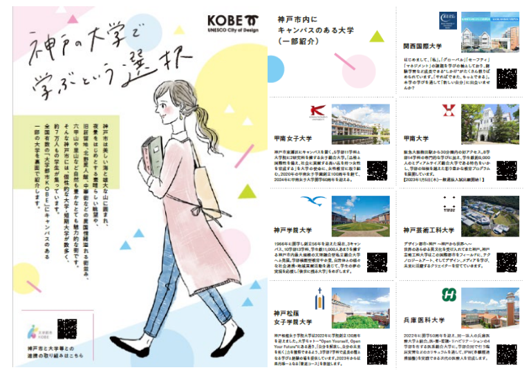
市内大学紹介チラシの配布