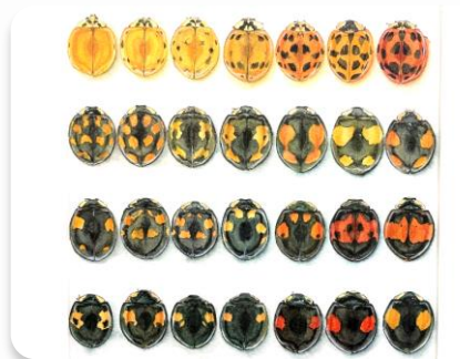
同種でも多様な模様を持つ ナミテントウ

同じ種でも異なる遺伝子を持つことにより、形や模様、生態などに多様な個性があり、環境の変化等に対応しやすくなっています。