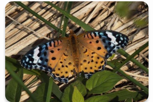
神戸市で見られる南方系昆虫

地球温暖化に加えて、都市化に伴うヒートアイランド現象による局地的な気温上昇、海水温上昇に伴う極端な気象現象が増加しています。また、南方系の昆虫の確認や、ブナ等の冷温帯に生育する動植物への影響が懸念されています。