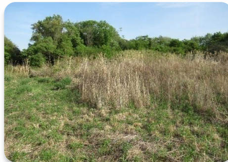
市内の耕作放棄地

また、狩猟圧の低下などにより野生鳥獣の生息数が増加し、植生への影響などが問題となっています。