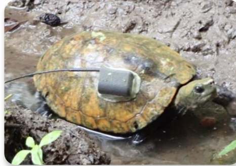
希少になったニホンイシガメ

山林等における開発や、河川改修による生息生育環境の縮小、消失などによる生態系ネットワークの分断や、沿岸域の開発に伴う埋め立てによる海域の藻場や干潟の消失が問題となっています。