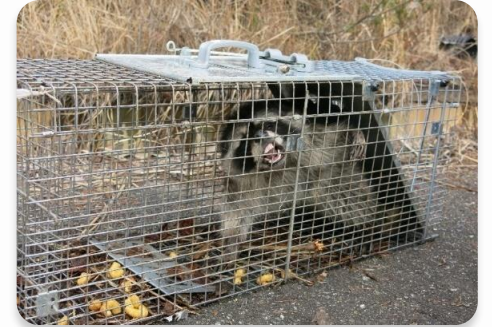
特定外来生物のアライグマ

アライグマ、アカミミガメ、外来カミキリムシ、ナガエツルノゲイトウ等の外来生物は在来種との共存は困難です。餌をめぐる競合や捕食等、従来の神戸の生態系や自然環境への影響を及ぼす可能性があるからです。