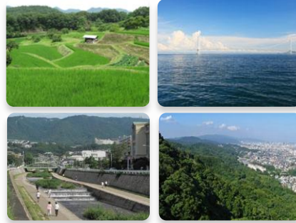
神戸の多様な自然

森林、里地里山、河川、ため池、海など色々なタイプの生態系があり、それらが街の近くにあるのが神戸の特徴です。