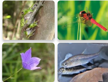
神戸に生きる多様な生きもの

動植物から細菌などの微生物にいたるまで、多様な生きものが生息・生育していることで、私たちの生活が成り立っています。