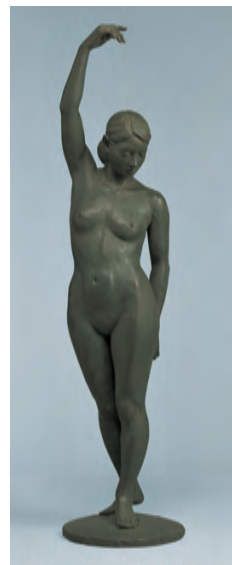
彫刻「秋に想う」岩谷誠久(特選)