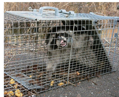
有害鳥獣・外来生物対策

利子所得として20.315%(所得税・復興特別所得税 15.315%+地方税 5%)が課税されます。