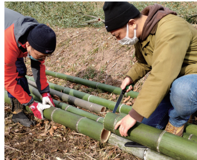
多井畑西地区の里山保全・活用

下記の取扱金融機関にてご購入いただけます。(神戸市役所では販売していません。)ご購入の際には、必要な手続きが各金融機関によって異なる場合があります。口座管理手数料等が必要となる場合がありますので事前に取扱金融機関にご確認ください。