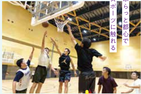
ふらっと都心で スポーツに触れる

約1,000㎡の競技場や多目的室、トレーニング室が備わった新しい体育館が、磯上公園内に誕生。競技場ではバスケットボールやバドミントン、多目的室では卓球やダンスなどのスポーツが楽しめます。平日は、トレーニング室が朝7時から23時まで利用できます。仕事前や仕事帰りに、三宮駅から歩いて行ける体育館で、体を動かしてみませんか。