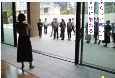
ふらっと都心で 文化に触れる

中央区役所新庁舎との複合施設として、中央区文化センターが誕生。それぞれの用途に応じた部屋で、音楽や料理、陶芸など、いろいろな文化活動が楽しめます。また、開放的な1階ロビーでは、ファッションショーなど、誰でも楽しめる旧居留地と調和したイベントを開催予定です。