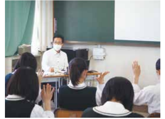
神戸甲北高校生と今西副市長の意見交換の様子

お住まいの地域に職員が出向き、さまざまなテーマについてご意見をお聞きする「出前トーク」。今年度より、政策を考えるにあたって、重要な役割を担う幹部職員がお伺いする新テーマを設けています。意見交換を通して、これからの神戸市について一緒に考えていきましょう。