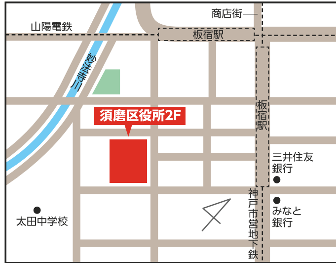
須磨区役所2階 【須磨区大黒町4-1-1】