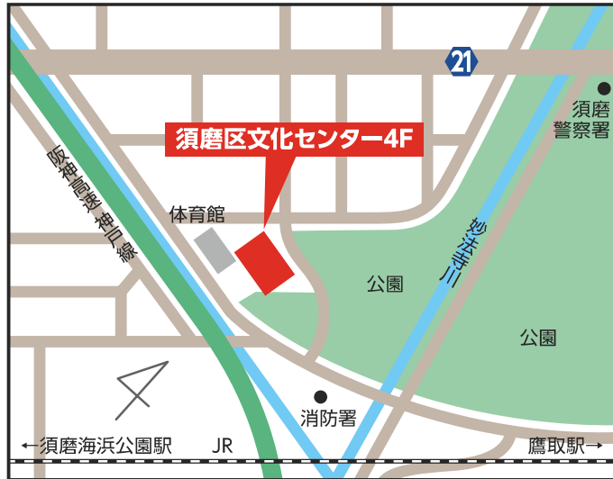
須磨区文化センター4階 【須磨区中島町1-2-3】