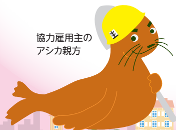
協力雇用主の アシカ親方