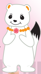
更生保護 女性会員の オコジョさん