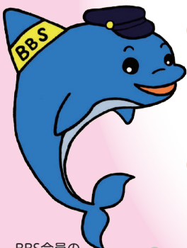
BBS会員の イルカ兄さん