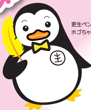
更生ペンギンの ホゴちゃん