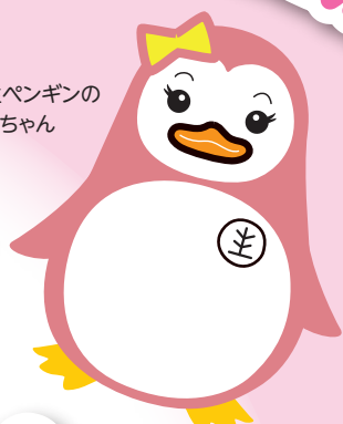
更生ペンギンの サラちゃん