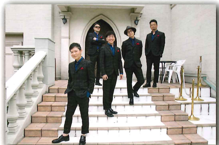
Chicken Garlic Steak