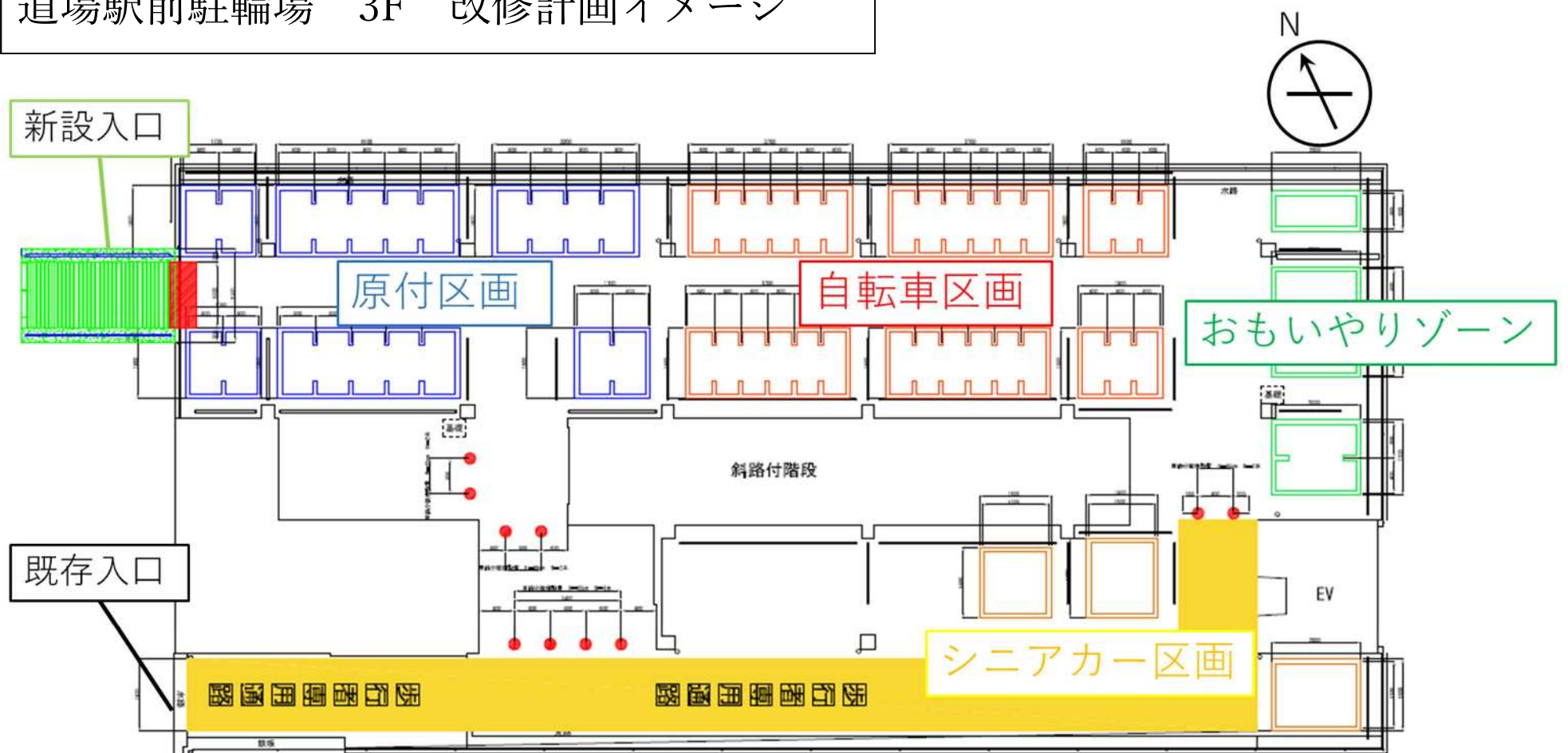
道場駅前駐輪場 3F 改修計画イメージ

道場駅前駐輪場につきまして、入口の新設および駐輪区画の変更工事を実施することとなりました。主に 3F の駐輪区画について、自転車・原付の区画を明確化し、広幅区画のおもいやりゾーンおよびシニアカーの駐車区画を設けることで、より快適にご利用いただけるよう改修します。つきましては、工事の影響のある期間は、 原付区画の利用停止および 3F の利用停止が発生します 。下記のスケジュールで利用停止を予定しておりますので、ご理解ご協力の程よろしくお願いいたします。