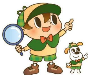
消費者教育センター マスコット 万が一くん 考助