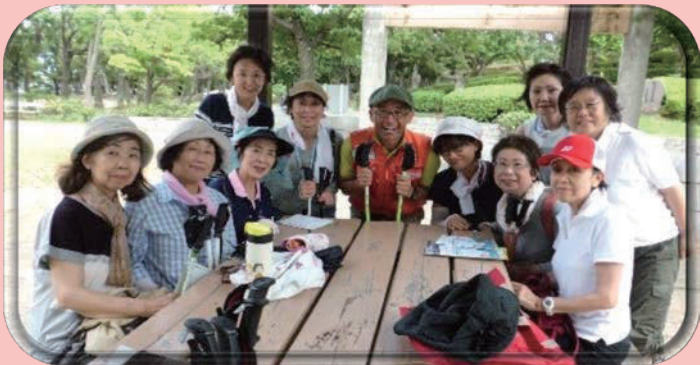
ノルディックウォーキング 大倉山公園