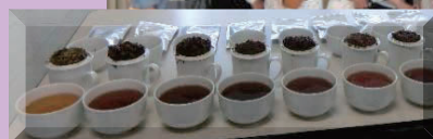
紅茶のテイスティング