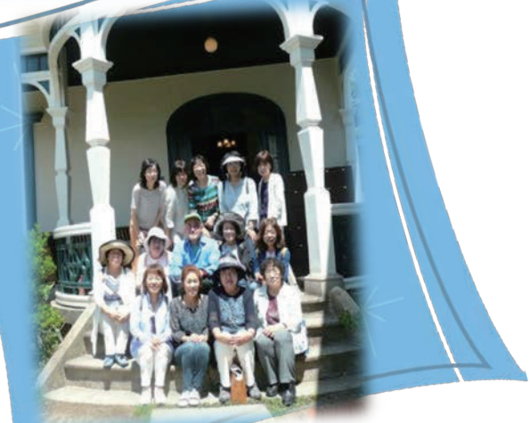
旧グッゲンハイム邸にて