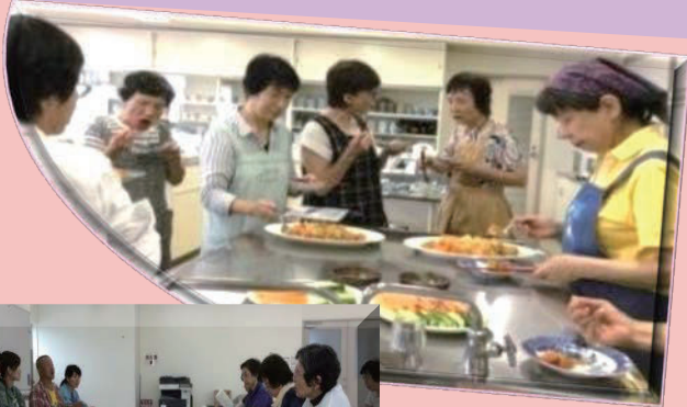
干し野菜の調理実験