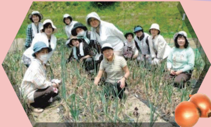
玉ねぎの収穫体験