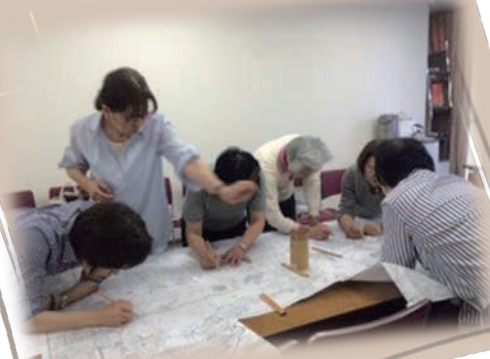
文化財地図作成中

研究テーマを「癒し」として取り組み卒論にまとめることができた。内容は、①癒しの概念の起りや歴史について、②癒しの体験を通して癒しが私たちの心身に及ぼす作用や効果について、③音の響きと癒しの関係についてであるが、この研究を通して、癒しは自然治癒力を高める処方箋であることが分かり、大変有意義であった。