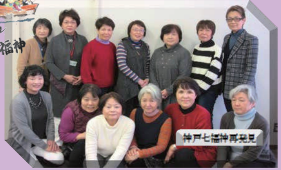
神戸七福神再発見