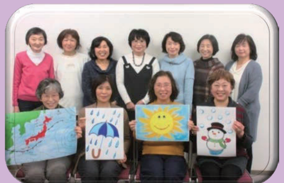
手作りイラストで皆おひさまの笑顔！

毎日一度は目にする天気図、気象情報は私たちのくらしに欠かせないものです。また最近の異常気象は日常生活に大きな影響を与えています。天気図の読み取り方を学び、また最近民間気象情報会社も増え、ピンポイントで気象情報を知ることができます。上手に利用、活用して豊かに過ごしていきたいものです。