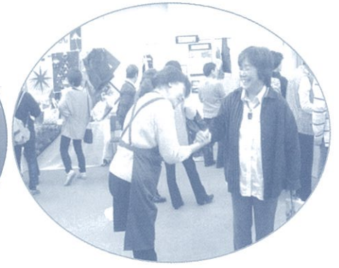
〈盛況の在校生・卒業生のグループ展示〉