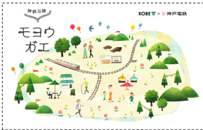
（「神鉄沿線モヨウガエ」公式サイトイメージ）

公式サイトでは、神戸市と神戸電鉄、そして神戸を想うあなたと共に、沿線をより一層魅力的なまち・空間へとリノベーションする「神鉄沿線モヨウガエ（模様替え）」の最新情報を神戸電鉄と共同で発信します。